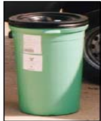
Contenedores COLOR VERDE