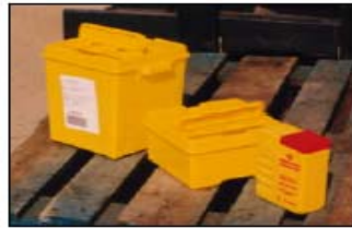
Contenedores para CORTANTES Y PUNZANTES