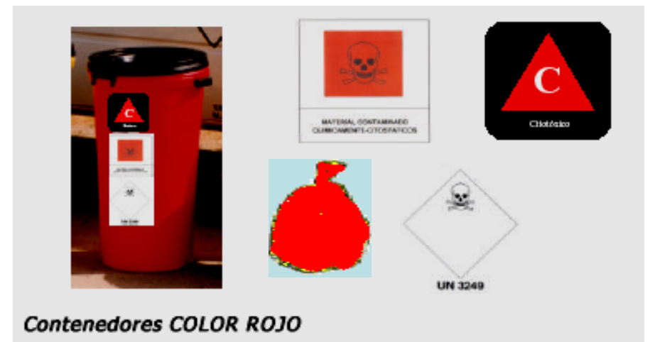
Contenedores COLOR ROJO